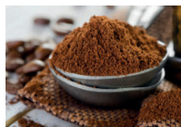
Café & Thé