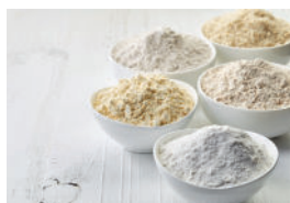
Sucre & Farine